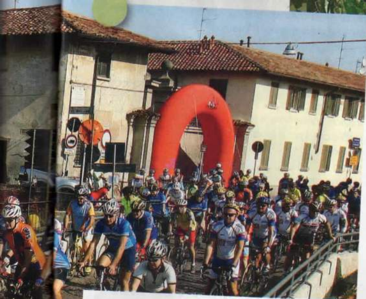
DI PAOLO TAGLIACARNE

A ll'ultima Eicma di Milano, domenica 20 settembre, è tornata la PedalatAzzurra, che, dopo dodici edizioni, si ripropone per diventare una rete di percorsi in Provincia di Milano, sulle piccole strade del Parco agricolo Sud e del Parco lombardo della Valle del Ticino. Alcune centinaia di chilometri di strade a bassissimo tenore di traffico, in un paesaggio inaspettato, ricco di tradizioni rurali, culturali, gastronomiche a poca distanza da un'area urbanizzata a elevata densità abitativa e produttiva, come è quella di Milano. Si può fare, basta volerlo. Dalla prima edizione del 1996 la PedalatAzzurra ha voluto percorrere e far conoscere quelle piccole, infinite e "zitte" strade di campagna che, messe in rete con cognizione, consentono di pedalare in tranquillità fuori dalle arterie con traffico intenso e veloce. Strade interpoderali che sono già naturali sedi ciclabili, da destinare prevalentemente alla mobilità più lenta o "dolce" come in molti ormai la definiscono. Per questo, appunto, "zitte". Il progetto vuole creare, partendo